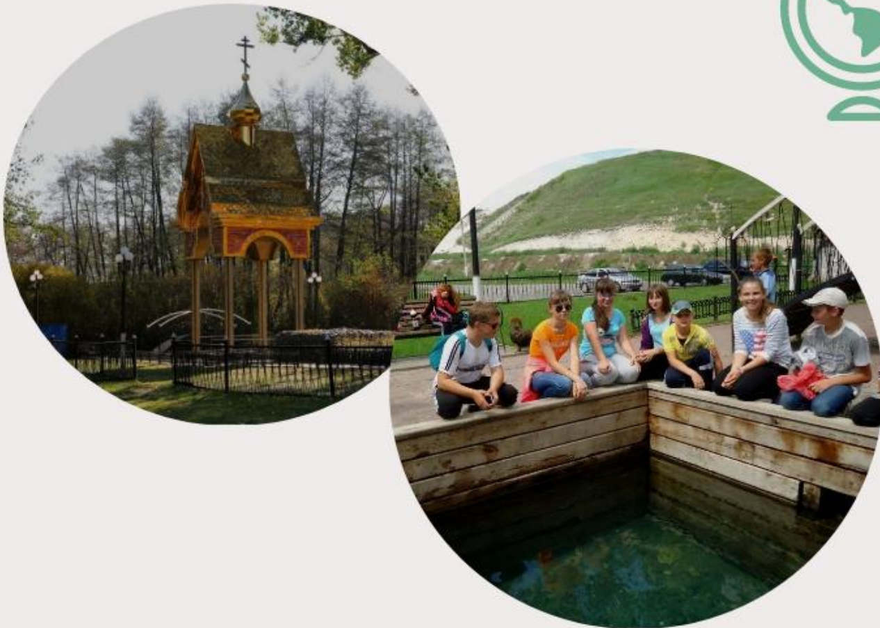
Родник "Ясный колодец" Белгородская область, Корочанский район, г.Короча, ул. Пролетарская,39