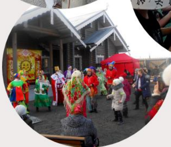
Город-крепость Яблонов Белгородская область, Корочанский район, с. Яблоново, ул. Заречная, 47